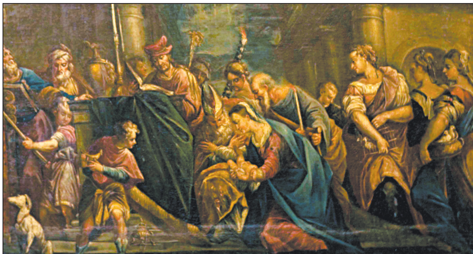
La Présentation de Jésus au Temple, anonyme, Abbaye de Saint-Maurice. MAMIN

CÉLÉBRATION ▶ Le 2 février, c'est la fête de la présentation de Jésus au temple, communément appelée Chandeleur.